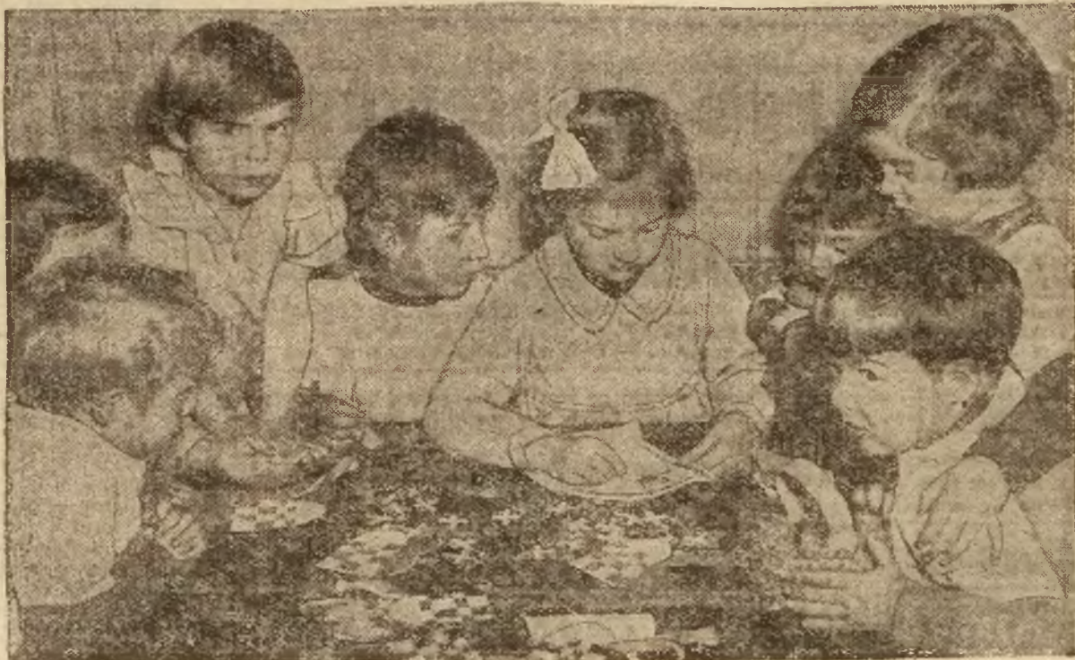
Dzieci w Skandynawii również robią zabawki na choinkę.

w Bazarze Przemysłu Ludowego Zamkowa 8, telefon 16-29 WILNO Zarzeczce 2, telefon 16-63 HURT DETAL