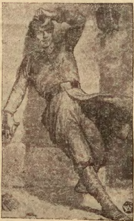
Na zdjęciu naszym reprodukcja obrazu Artura Grottgera, pt. „Pierwsza ofiara” z cyklu Warszawa”.