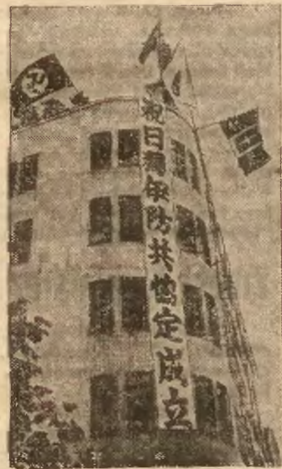
Oto manifestacja trójpriymierza japońsko-włosko-niemieckiego na budynku tokijskiego dziennika.