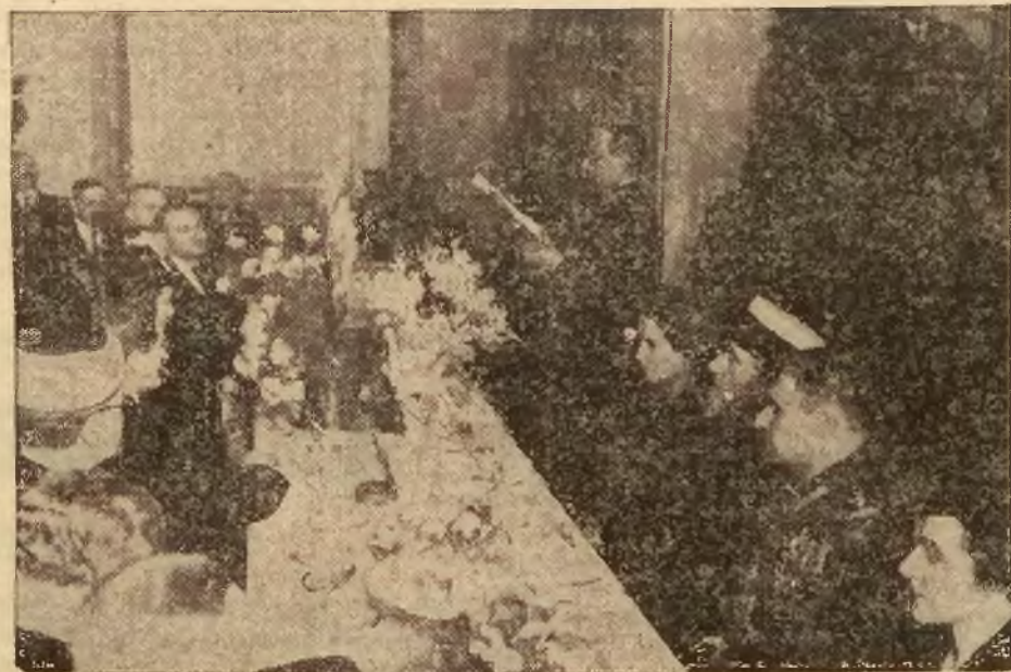
Zdjęcie z uroczystego pożegnania Szefa O. Z. N. gen. Stanisława Skwarczyńskiego, dotychczasowego dowódcy dywizji piechoty legionowej w Wilnie, przez władze, wojsko, duchowieństwo i społeczeństwo m. Wilna oraz województwa wileńskiego. Reprodukujemy moment z przemówienia pożegnającego gen. Skwarczyńskiego.