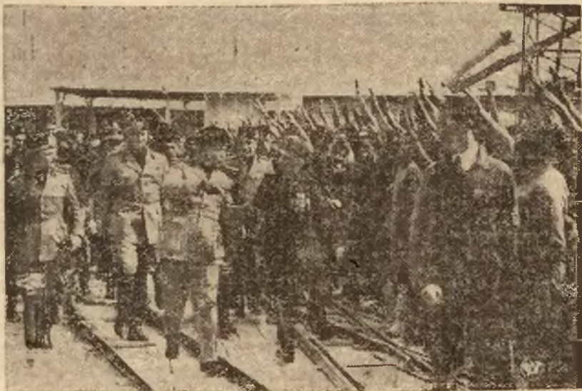
Mussolini przechodzący przed frontem pałacy i mechaników włoskiego okrętu „Littorio”.