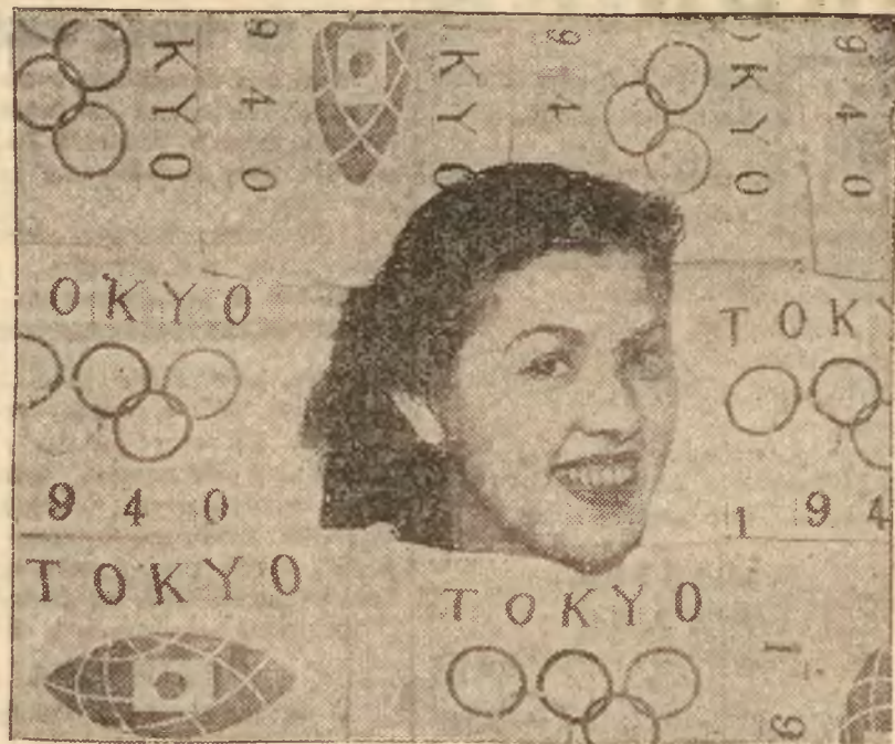
Japończycy, pomimo wojny w Chinach, nie zaniedbują wielkiej propagandy na rzecz swego kraju — dowodem tego jest przeprowadzana na szeroką skalę reklama najbliższej Olimpiady, która ma się odbyć w Tokio w roku 1940.