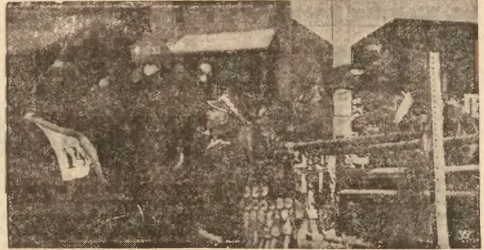
Zdobywca drugiej nagrody na Zbiegu — rtm. Komorowski, w czasie skoku, o moment składania rtm. Komorowskiemu gratulacji przez Pana Marszałka Smigłę go Rydza.

W ramach XI Międzynarodowych Konkursów Hippicznych, na stadionie w Łazienkach został rozegrany konkurs armii polskiej im. Pierwszego Marszałka Polski Józefa Piłsudskiego. Konkurs ten należał niewątpliwie do najciekawszych imprez