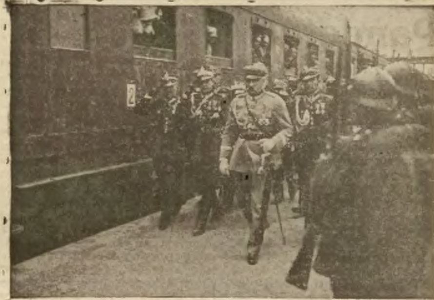
Marszałek Piłsudski przed frontem kompanii honorowej w chwili po przybyciu do Wilna.