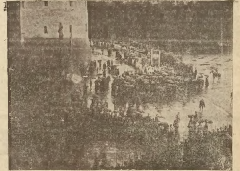
Pochód z obrazem i zmierza do Kaplicy Ostrobramskiej.