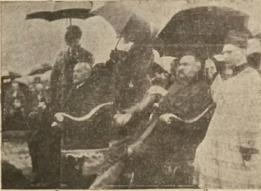
Prezydent Rzeczypospolitej i Marszałek Piłsudski na Placu Katedralnym.