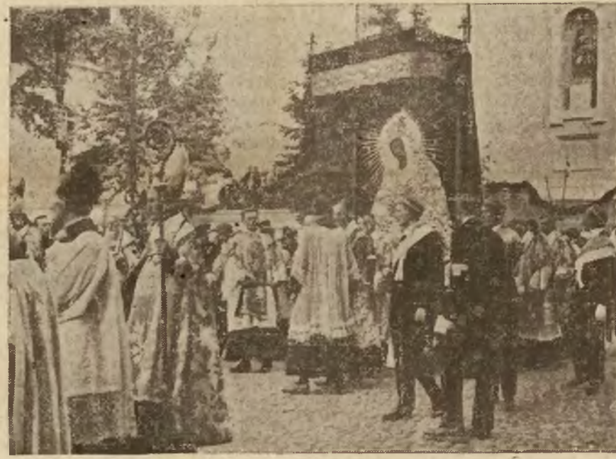
Ćudowny obraz po koronacji niesiony do Ostrej Bramy.