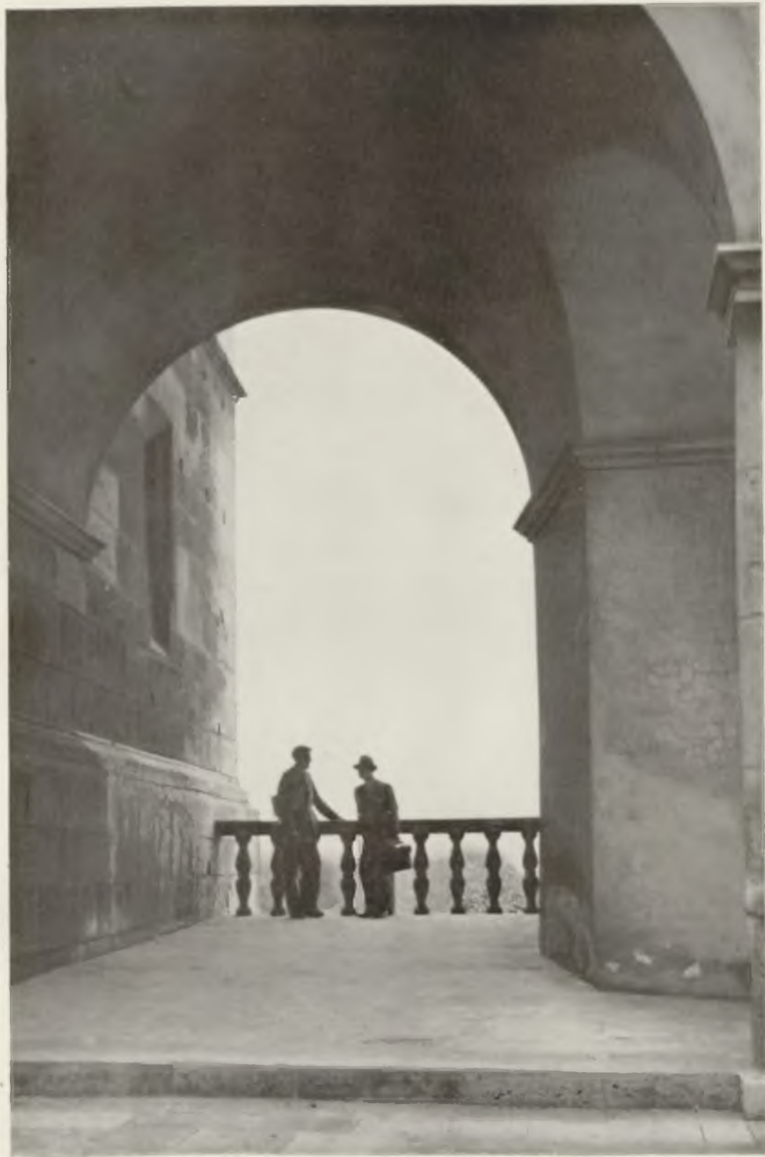
VISITES KATOWIŃSKIE — Raymond Nicolet à Cracovie