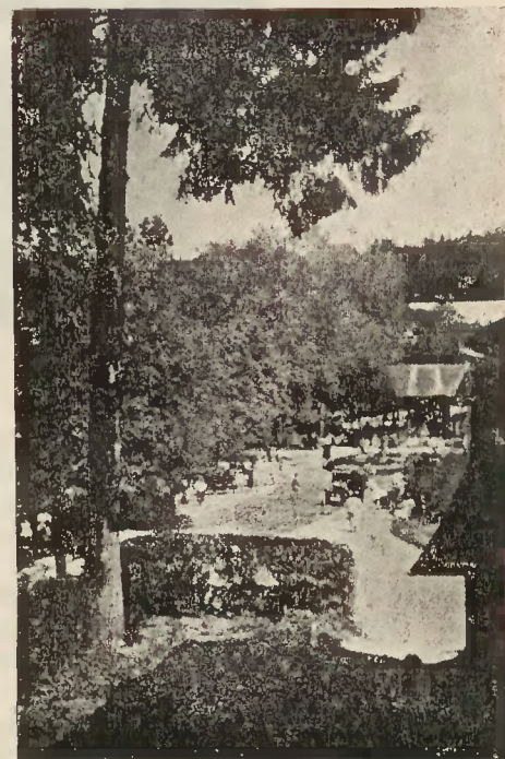
Na deptaku rabczańskim

Die Badegäste finden in Rabka Unterkunft in weit über 3000 Gastzimmern, wovon ca 300 Zimmer auf das Kurhaus entfallen. Dem Kurhotel sind Wannenbäder und ein Restaurant angegliedert. Alle der Kurverwaltung angehörenden Häuser sind mit Wasserleitung, elektrischem Licht und Abwässerkanälen versehen ; auch viele andere Häuser sind mit diesen Einrichtungen ausgestattet. Insgesamt sind in Rabka zwei erstklassige Restaurants, Cafés, Molkereien (Milchtrinkstellen), einige Gasthäuser sowie ca 70 Pensions tätig.