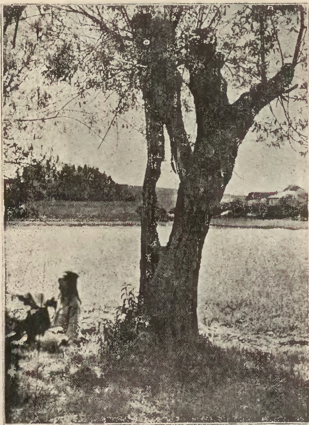
Łąki Parku zakładowego w Rabce

Der Kurort Rabka liegt im westlichen Teile Kleinpolens (ehem. Galizien) und zwar mitten in den Karpathen, auf sonnigem Hügelgelände ca 520 bis 540 Meter ü. d. M. Er hat eine besonders malerische Lage : ringsum erheben ihre Häupter waldbekränzte Berggipfel und rauschen stille Wälder. Das erfrischende Höhenklima, die ausgezeichnete, staubfreie, mässig feuchte Luft und wertvolle Mineralquellen brachten es mit sich, dass Rabka sich zu einem idealen Kurort entwickelte, wo besonders Kinder und Jugendliche einen überaus zuträglichen Aufenthalt finden. Jahraus jahrein strömen hier Tausende von kleinen Patienten herbei, um Heilung, Kräftigung und Abhärtung zu suchen — und zu finden. Was Wunder, wenn Rabka — wohlverdient — das Kinderparadies genannt wird.