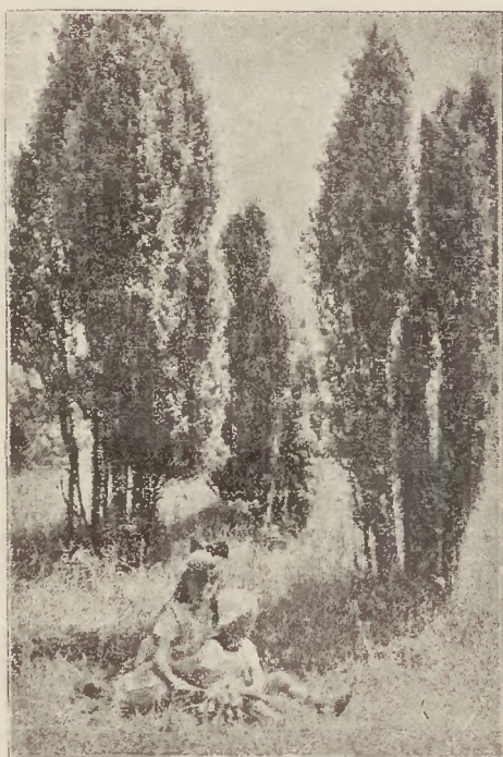
Wśród rabczańskich parkowych trawników...