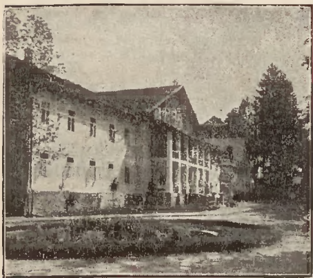
Rabka — Dom Zdrojowy

wird in besonderen Badewannen behandelt); chronische Katarrhe der Luftwege und des Lungenfells als Begleiterscheinungen, weiterhin Neigung zu Katarrhen und die damit verbundene Engrüstigkeit des Lungenfells; Erkrankungen der Lungenhöhlendrüsen, der Darmhaut u. s. w.; chronische Nasen-, Kehlen-, Mittelohrkatarrhe, chronische Entzündungen der Serumhäute, besonders des Bauchfells (peritonitis chr.), schwer einsaugbare Exsudate bei Entzündungen des Bauch- und Lungenfells, des Herzbeutels, der Gelenke u. s. w.; Gelenks- und Muskelrheumatismus, besonders in früheren Stadien; die englische Krankheit (rhachitis); Syphilis im zweiten und dritten Stadium und allen Erscheinungsformen; Stoffwechselstörungen; erste Stadien der Arterienverkalkung; schwer zu heilende Propersionswunden, chronisches Malariafieber (Schüttelfrost); Frauenkrankheiten wie: mastitis chr., fibromyoma uteri, residua post peri- sowie parametritidem, metritis und endometritis chr. und überhaupt alle Krankheitszustände, deren Heilung eine Beschleunigung des Stoffwechsels erfordert.