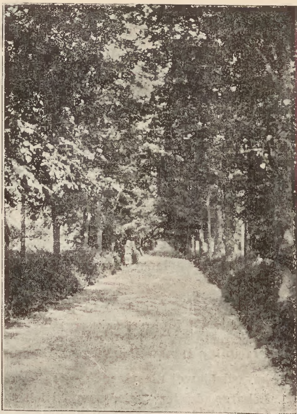
Aleje Parku zakładowego w Rabce