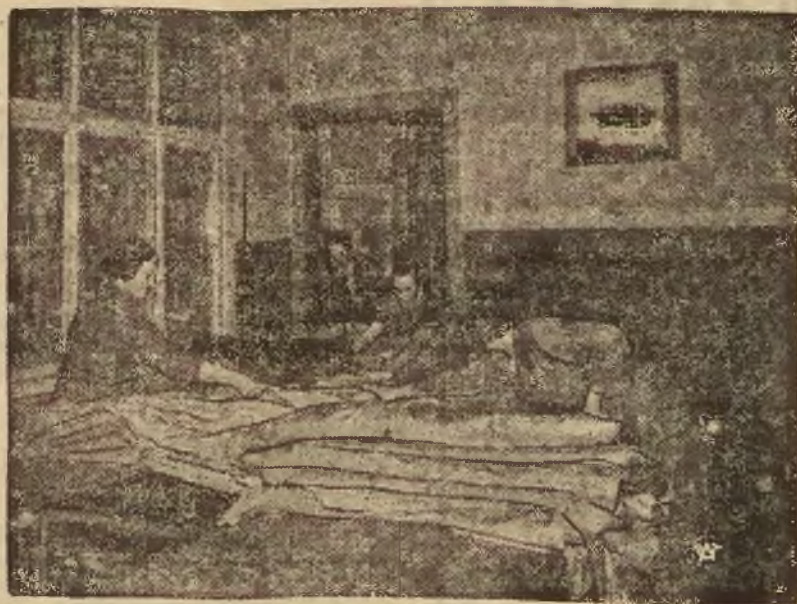
Shycie powłoki balonu.