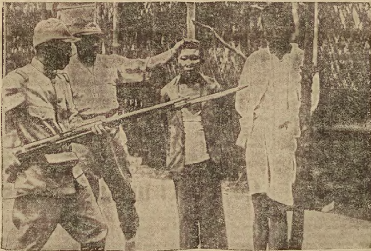
Zdjęcie przedstawia moment, gdy dwaj młodzi Chińczycy, jako wywiadowcy partyzanckiej grupy na tyłach wojsk japońskich zostali schwytani przez Japończyków „na gorącym uczynku”.