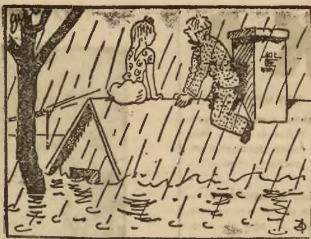
— Na złość musiałem zostawić parasol w piwnicy!

w ciężkiej: Piłat (Śląsk), Doroba (Warszawa), Białkowski (Poznań), Sadowski (Pomorze).