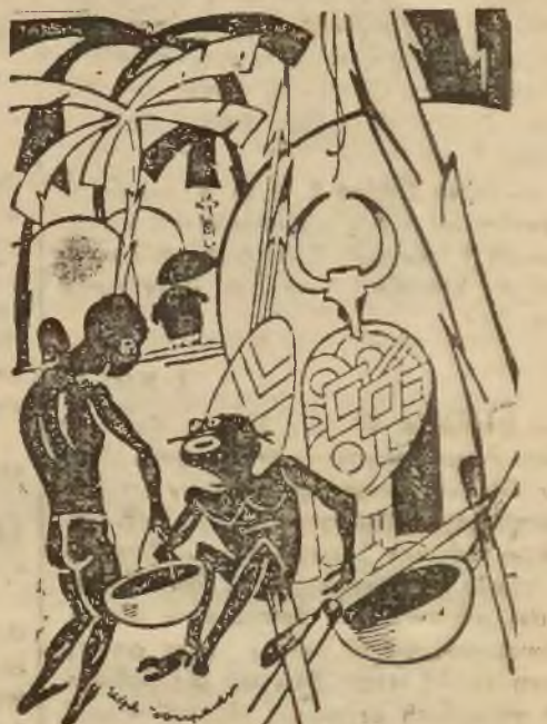
— Spróbuj, Gimbo to jest ten nowy misjonarz, przysłany wczoraj przez Anglików.

CASINO] Nowe obracanie! Nowa kopia! Bohaterski epos osnuty na tle walk o niepodległość Polski Dziesięciu z Pawiaka W rol. gl.: Brodzisz, Batoryka, Lubieńska, Węgrzyn, Samborski i inni — ATRAKCJE