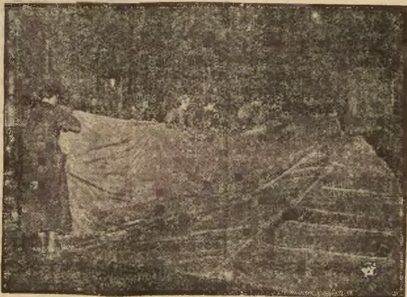
Powłoka balonu stratosferycznego.