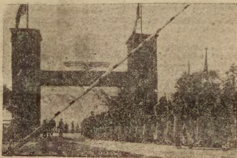
Moment uroczystego wjazdu do bram Norymbergi oddziałów wojsk niemieckich.

Przed otwarciem kongresu odbyła się defilada młodzieży przed kanclerzem Hitlerem i dostojnikami partyjnymi.