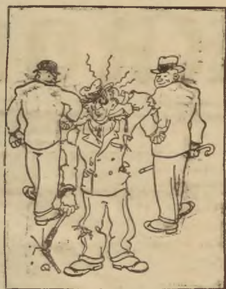
Ten, który chciał, żeby pokój zapanował...

W rolach głównych: Tyrone Power oraz Alice Fay Ulgi nieważne. Nadprogram: DODATKI. Uprasza się o przybycie na początku seansów: 4—6—8—10,15.