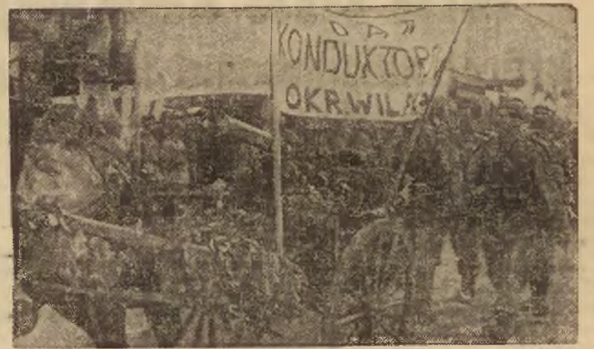
Podczas uroczystego powitania, wracającego z manewrów do koszar wojska garnizonu wileńskiego, konduktorzy okręgu wileńskiego PKP wręczyli przedstawicielom armii tytułem daru 1 c. k. m. i granatniki. Na zdjęciu — defilada powracających do Wilna oddziałów. Na pierwszym planie dary konduktorów wileńskich.