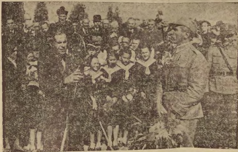
Tradycyjna już w Wilnie uroczystość powitania wracających z manewrów pułków wileńskich, transmitowana była w tym roku przez Rozgłośnie Wileńską. Przed mikrofonem Dowódca Dywizji Piechoty Legionów