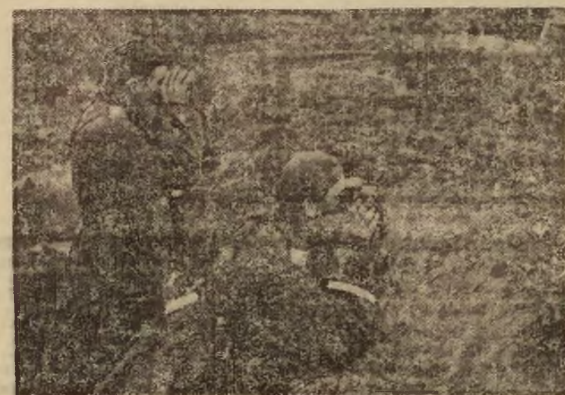
Na posterunku obserwacyjnym za szanem