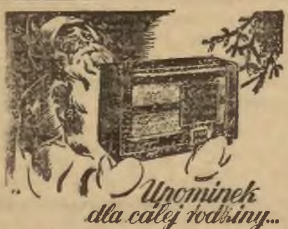
Upominek dla całej rodziny...

* Rosyjska nazwa wagonów towarowych, w których w czasie wojny przyjeżdżali ewakuujący się rodziny wraz z dobytkiem.