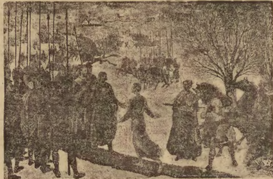
Bolesław Chrobry, witający Ottona III, pielgrzymującego do grobu św. Wojciecha w Gnieźnie. Rok 1000.