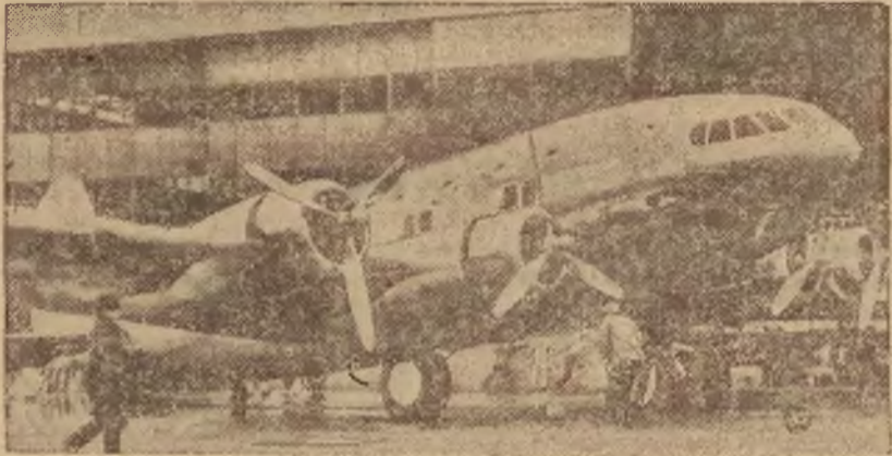
W Stanach Zjednoczonych niedługo rozpoczyna się próba oblatywania nowego typu samolotu. Będzie to samolot przeznaczony do szybowania na wysokości do 6.500 metrów i mogący rozwijać szybkość do 400 klm. na godz. Specjalnie przystosowana do lotów stratosferycznych kabina będzie mogła pomieścić 33 pasażerów. Ten nowy kolos powietrzny będzie zaopatrzony w cztery silniki.