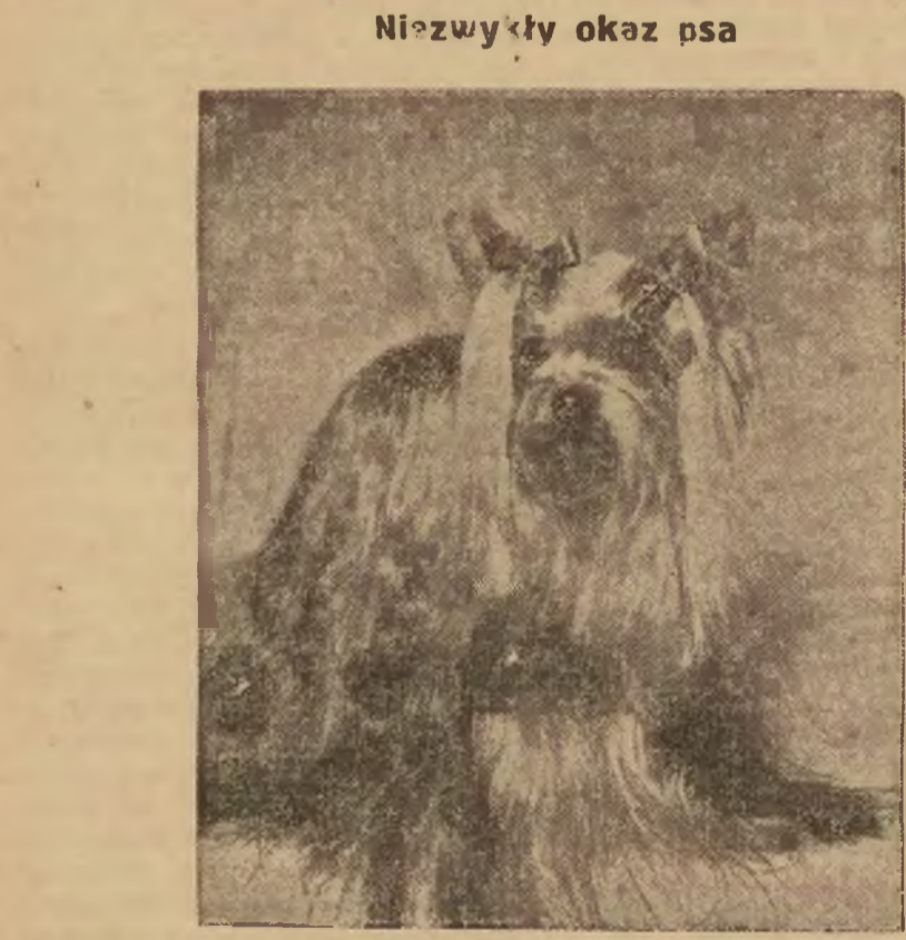
Niezwykły okaz psa z rasy Yorkshiro Terrier o wyjątkowo długim owłosieniu, który zdobył pierwszą nagrodę na wystawie psów rasowych w New Yorku.

Wczoraj około godz. 5 Stanisław Niedzwiedzki, jadąc szybko rowerem, nie dostrzegł sygnału samochodu i wpadł na maszynę. Rower i samochód zostały uszkodzone. Niedzwiedzkiego pogotowie przewiozło do szpitala.