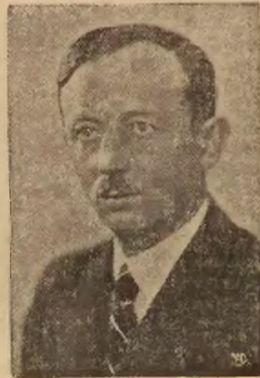
Przewodniczący parlamentu słowackiego Marcin Sokol.