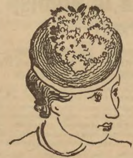
Dwa modele słokwowych kapeluszy.