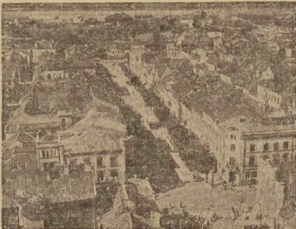
Rzut oka na Kłajpedę. Na dalszym planie fragment z portu

brakowało środków komunikacyjnych. Pociągi były przepełnione ciężarówkami, zaś i innymi środkami lokomocji rozporządzano w niedostatecznej ilości, to też były one trudno dostępne. Również ceny za środki lokomocji b. wzrosły.