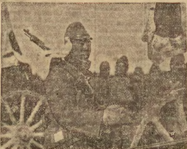
Wojskom japońskim, operującym w Chinach towarzyszą, jak to widzimy na zdjęciu, gołębie pocztowe, które są używane w służbie łączności między oddziałami a dowództwem