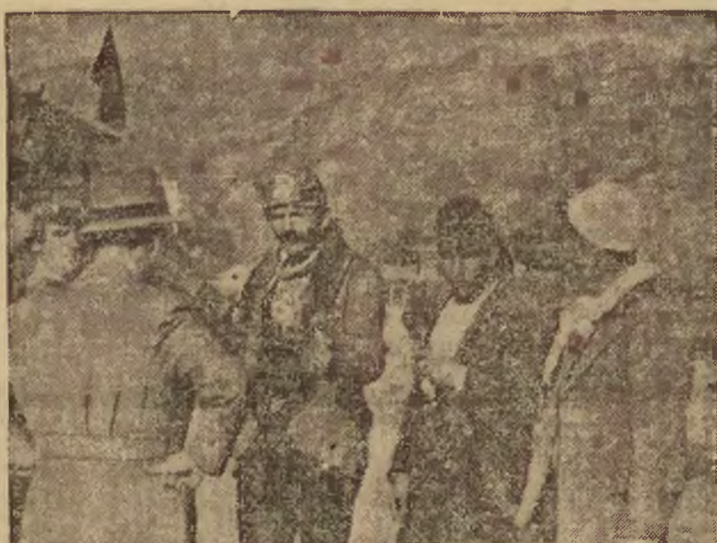
Grupa uciekinierów albańskich zatrzymana przez jugosłowiańską straż graniczną na przejściu granicznym pod Skutari. Straż przeprowadza rewizję.