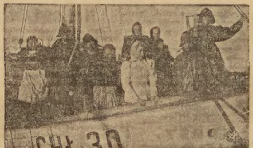
Rozpoczęcie wiosennych połowów flaków i łososi na morzu polskim stanowi jeden z najbardziej radosnych okresów, czemu daje wyraz zwłaszcza młodzież rybacka odjeżdżająca na pierwszy połów. — Flotylla rybacka przygotowana do odjazdu.