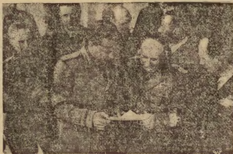
Minister Ciano w otoczeniu oficerów włoskich wśród witającej go ludności.