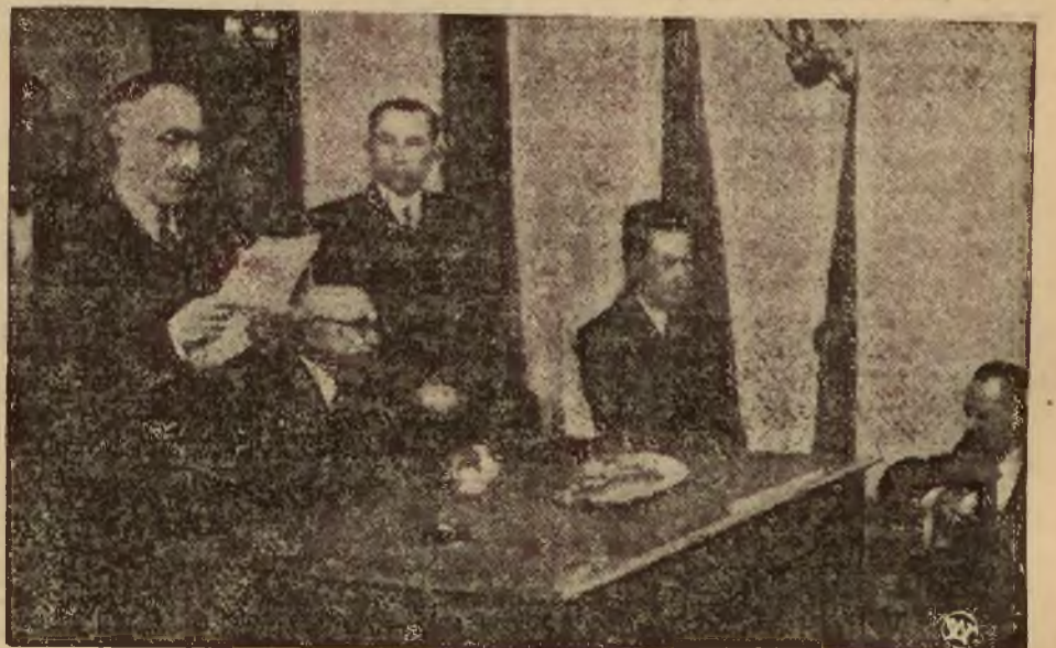
Zdjęcie przedstawia moment z przemówienia premiera albańskiego Shkaka Verlazzi, którym prosi króla Wiktora Emanuela o przyjęcie korony albańskiej.

W odpowiedzi Wiktor Emanuel III podziękował za ofiarowaną mu koronę i oświadczył, iż przyjmuje koronę, z którą związane jest sławne imię bohatera albańskiego Skanderberga. Król dodał następnie, iż przyjmuje przysięgę narodu albańskiego na wierność oraz zapewnił, że rząd jego zobowiązał się zagwarantować Albanii porządek, poszanowanie swobód religijnych, postęp cywilizacyjny, sprawiedliwość społeczną, a wraz z obroną wspólnych granic również pokój.