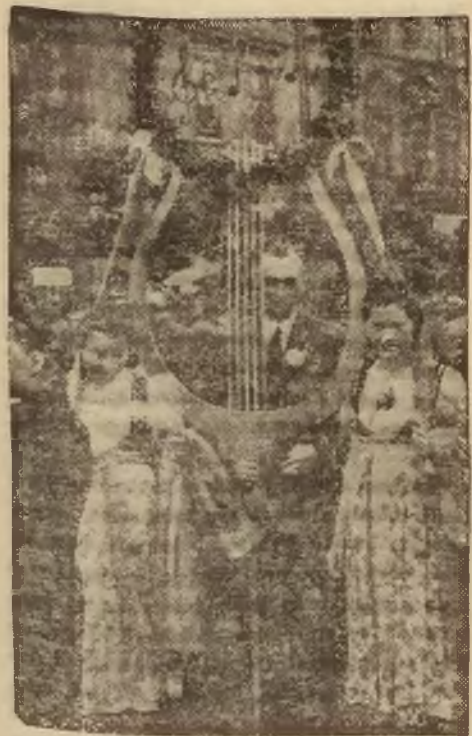
W Cieszynie odbył się V Zjazd Chórów Tow. Śpiewaczy Śląskich. Na zdjęciu — chóry śląskie, biorące udział w zjeździe, w pięknych regionalnych strojach, podczas inauguracji zjazdu na placu Sobieskiego w Cieszynie