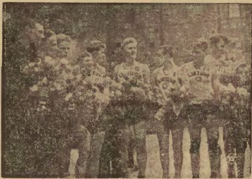
W Kownie zostały zakończone III mistrzostwa Europy w koszykówce, w których brała m. in. udział reprezentacja Polska. Na zdjęciu — drużyna litewska, która zdobyła tytuł mistrza Europy.