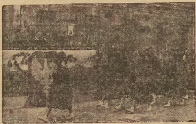
Min. Kościałkowski przyjmuje defiladę młodzieży osadniczej w Grodnie.

artystyczny znowu Wilno. Orkiestry dęte: za pracę całoroczną — Warszawa, Wilno, Grodno; za poziom artystyczny — Wilno. Poza konkursem dyplom został przyznany zespołowi orkiestry z Brześcia. Poza tym dyplomy przyznano: Gimnazjum żeńskiemu Zw. Osadników w Wilnie oraz chórowi mieszanemu również z Wilna. Wręczenie nagród i dyplomów zwyciężkim zespołom dokonał p. min. Marian Zyndram-Kościałkowski.