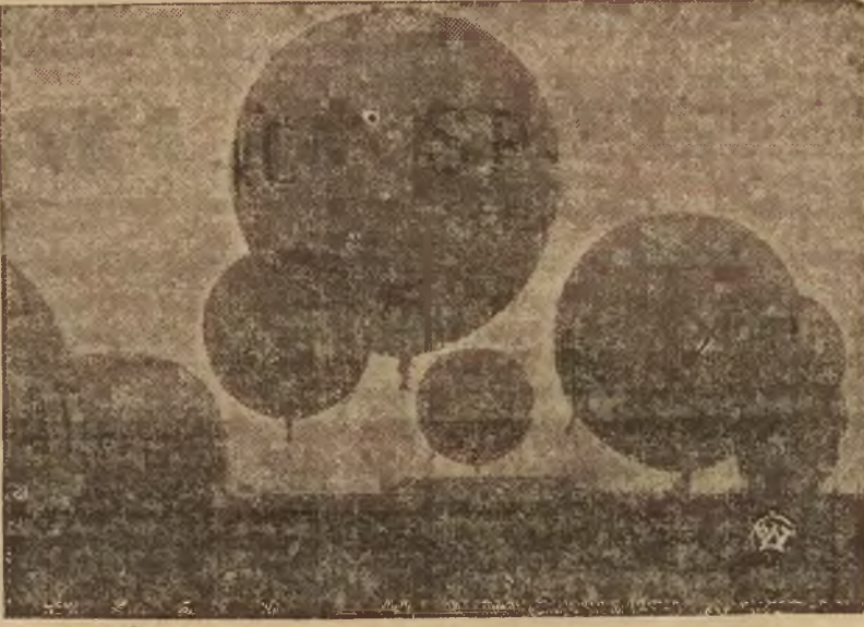
W Mościcach odbyły się po raz drugi krajowe zawody balonów wolnych o puchar im. pl. Wańkowicza. Wszystkie balony, biorące udział w zawodach wylądowały szczęśliwie. Na zdjęciu — moment startu balonów.