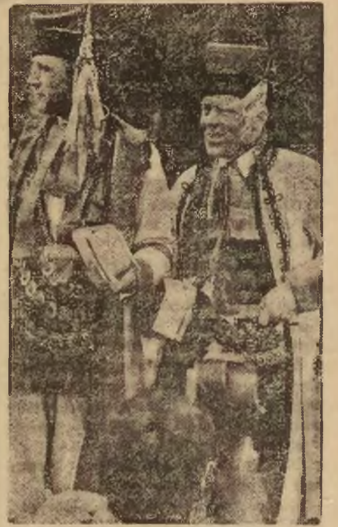
Rolnicy polscy w krakowskich sukmanach przy okolicy S/S „Tułaski“ po przybyciu do Kopenhagi przyglądają się z zainteresowaniem panoramie miasta.