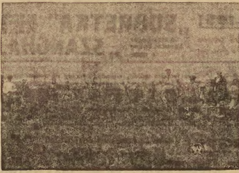
Na zdjęciu — „Dzień Pracy“ w gminie prozorockiej.

Przybyła do pracy ludność w ilości 693 osób otrzymała obiad z kuchni polowych. W przerwie obiadowej przygrywała orkiestra KOP, zaś wieczorem odbyła się zabawa ludowa w polu.