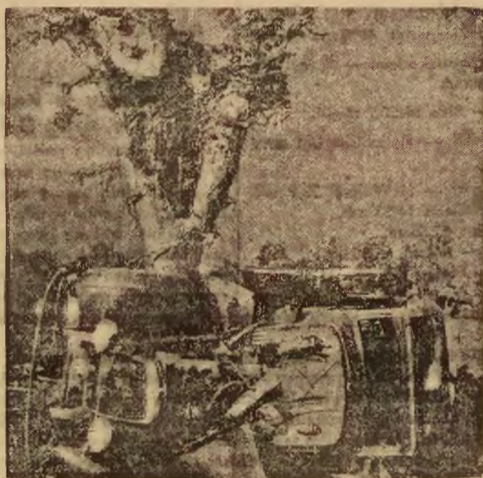
Tragicznie zakończyła się wycieczka, udająca się dużym autokarem do fermy Anokis w Stanach Zjednoczonych. Samochód dostał się w strefę szalejącego tajfunu i sięgnął wicher został rzucony na drzewo i doszczętnie zdużgotany. W katastrofie zginęło 10 osób, zaś 60 zostało rannych. Na zdjęciu widok strasznej katastrofy samochodowej spowodowanej tajfunem.