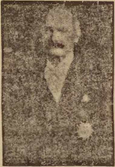
ALBERT LEBRUN Prezydent Republiki.