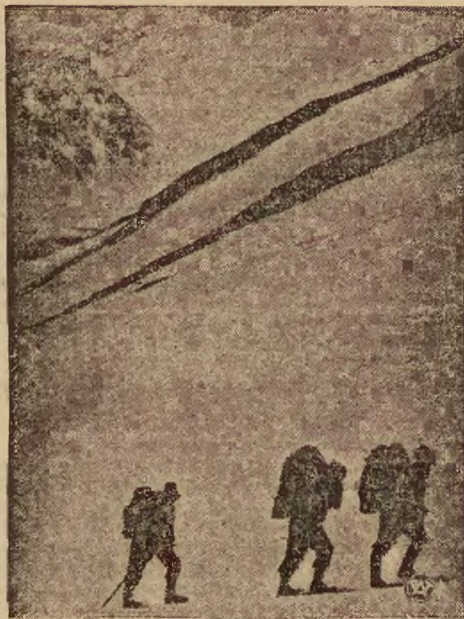
Na zdjęciu 1. — tragarze wyprawy „przy pracy“ podczas przenoszenia ładunków z bazy do łańcucha wyższych obozów, które wyprawa założyła na obranym szlaku ku szczytowi Na zdjęciu 2. — widok na szczyt Nanda Devi od wschodu. W lewo ciągnie się długa i urwista południowa grań, której szczyt został osiągnięty.

Jak już sygnalizowaliśmy, pierwsza polska wyprawa w Himalaje, zdobyła szczyt Nanda Devi. Obecnie reproduujemy fragmenty z tej wyprawy.