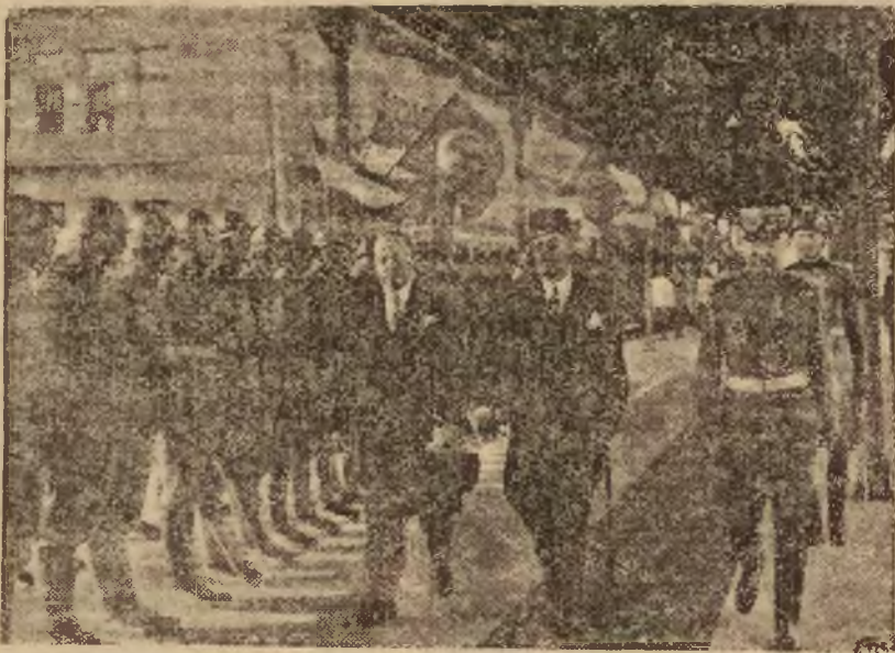
Białogród odwiedził w dniach ostatnich minister spr. zagr. Egiptu, Jakja Pasza, powitany na dworcu przez jugosłowiańskiego ministra spr. zagr. Cincar-Markowicza. Na zdjęciu — moment przybycia min. Jakja Paszy na dworzec białogrodzki. Z lewej — min. Markowicz.