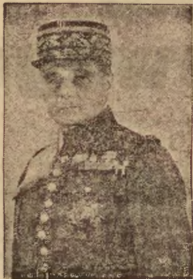
GEN. GAMELIN Wódz Naczelny.