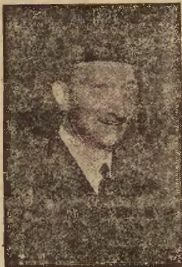
BONNET Minister Spraw Zagranicznych.