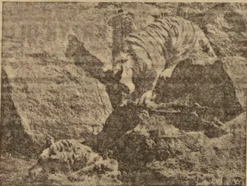
Tygrys zażywa kąpeli w czasie wielkich upałów. Zdjęcie to wykonane zostało w jednym z ogrodów zoologicznych zagranicą.