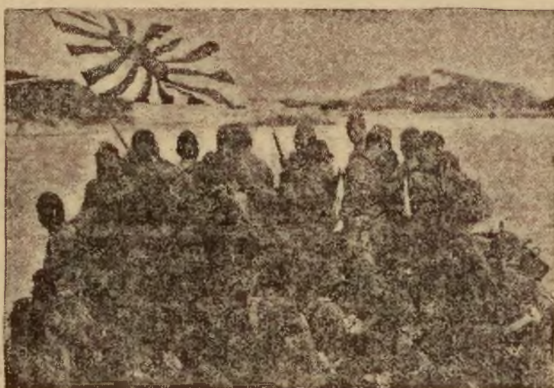
Na zdjęciu — desant japoński w porcie Swatów, zajęłym ostatnio przez wojska.