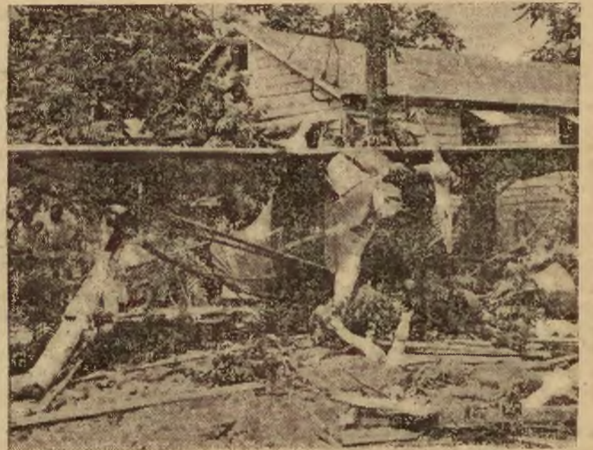
Widok katastrofy lotniczej, która wydarzyła się w miejscowości Woodland Beach w St. Zjednoczonych. W parę chwil po starcie samolot, wskutek uszkodzenia silnika musiał lądować przymusowo na podwórzu bungalowu. Na zdjęciu strząskany samolot.