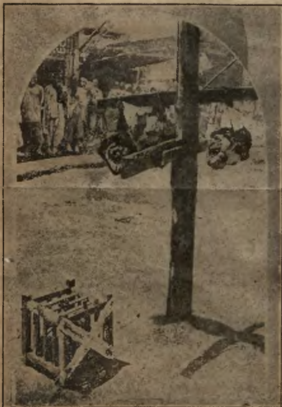
Comment on exécute les révolutionnaires: la tête détachée est mise dans une cage en bois et exposée dans les ruelles pour effrayer les habitants.

La dynastie s'affaiblissait, au fur et à mesure que les difficultés extérieures augmentaient; le peuple chinois était réduit à une misère épouvantable.