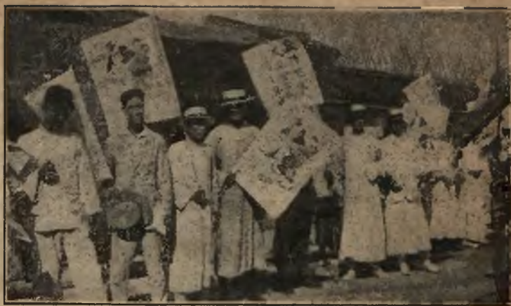
Une manifestation organisée par la Société Chinoise de Secours aux Victimes de la répression.