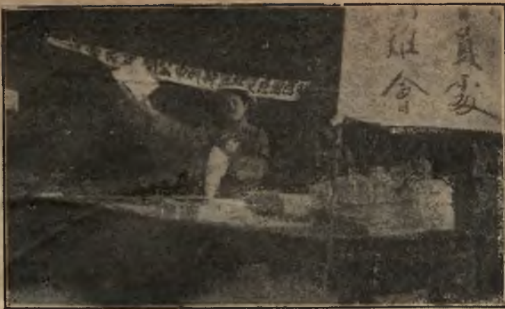
Pour l'anniversaire de Sun-Yat-Sen. Diffusion de brochures et de publications.