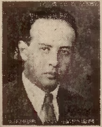
CONFERENCIA INTERAMERICANA SOBRE PROBLEMAS DE LA GUERRA Y DE LA PAZ

La nueva Guatemala revolucionaria saluda por mi medio al noble y heroico pueblo de Polonia y anhela que pronto resurja libre y próspero para realizar su alto destino histórico. F. Alvarado