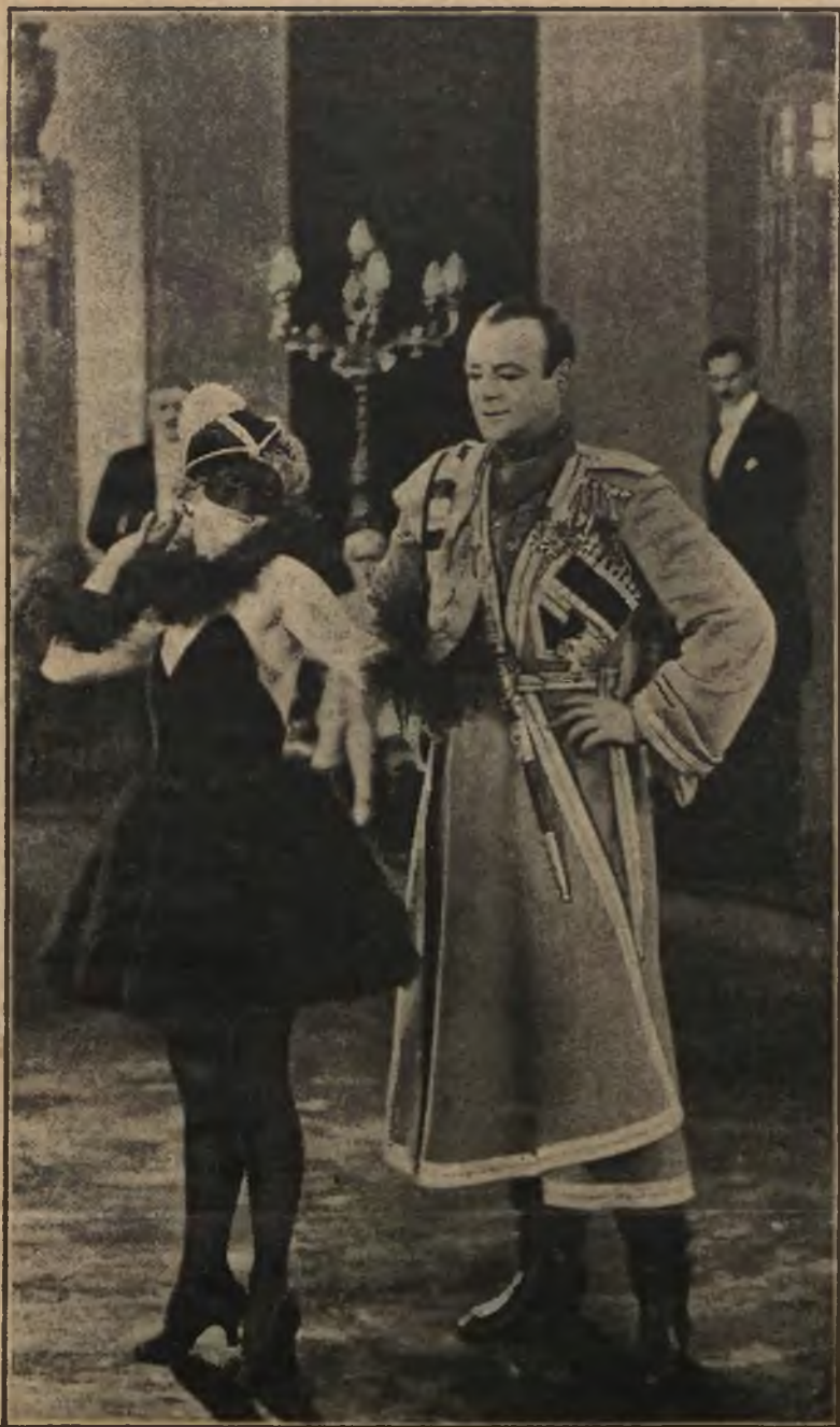
Scena z filmu p. t.: „Carscy książęta“.

Taki właśnie film z życia wykolejonych emigrantów rosyjskich, w orgjastycznym życiu Paryża szukających ukojenia i szaleńczeni wybrykami usiłujących zgłuszyć dręczącą nostalgię — zobaczymy wkrótce na ekranie kinoteatrów lwowskich.