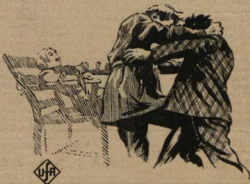
Obraz z filmu p. t.: „Szpiegi“.