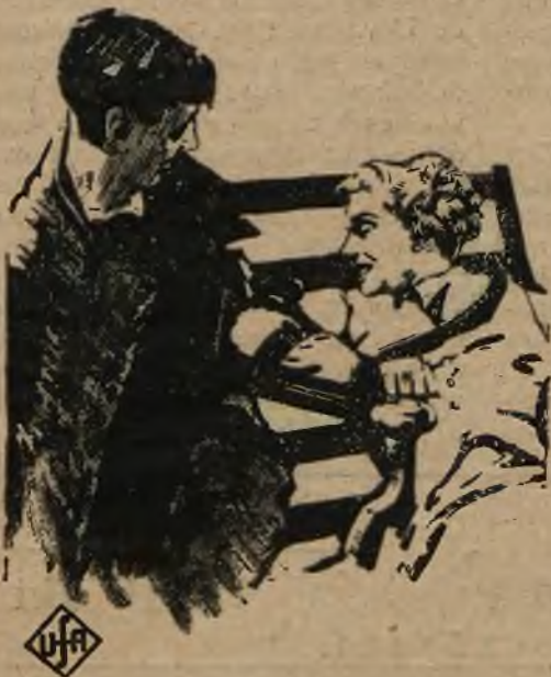
Scena z filmu p. t.: „Ofiara kabaretu Hong-Kong“.

Zdobywszy powodzenie w „Kole małżeńskim“, zdobyła wkrótce wszechstronny awantaz i dzisiaj jest wszechwładną gwiazdą wszechświatowej wytwórni „Paramountu“ i kończy najbardziej jej właściwościom odpowiadający film, treścią i tendencją wskazujący na jej ogniem połyskujące włosy — jako symbol wrącego, wulkanicznego uczucia.