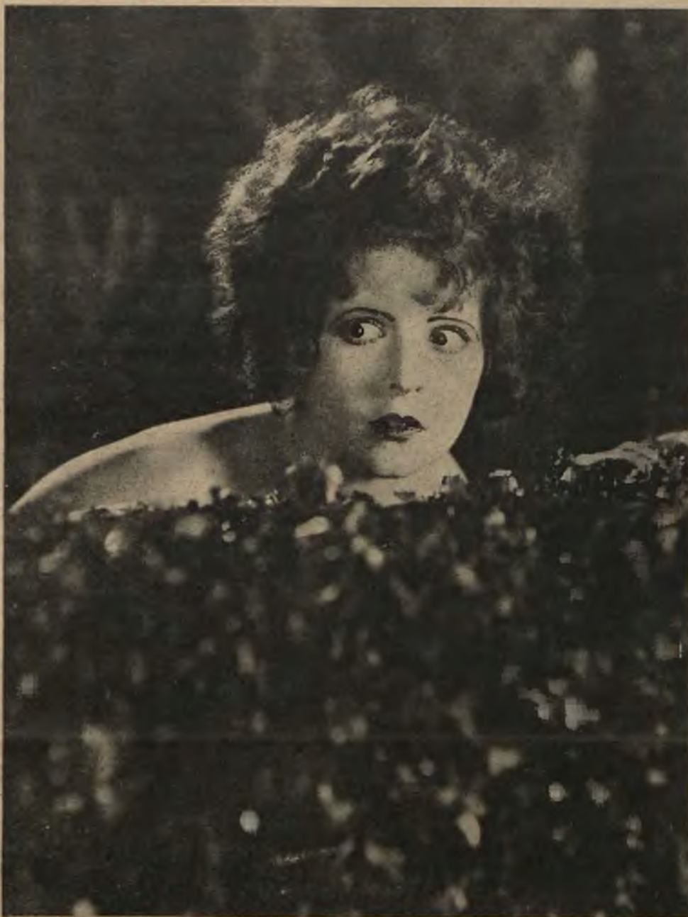
CLARA BOW uroczą gwiazdą Paramount'u, którą wkrótce Lwów ujrzy na ekranie.

Lecz w Hollywood — w tem środowisku nadludzkich wysiłków, olbrzymich ambicji i rozkapryszonych gustów, często-