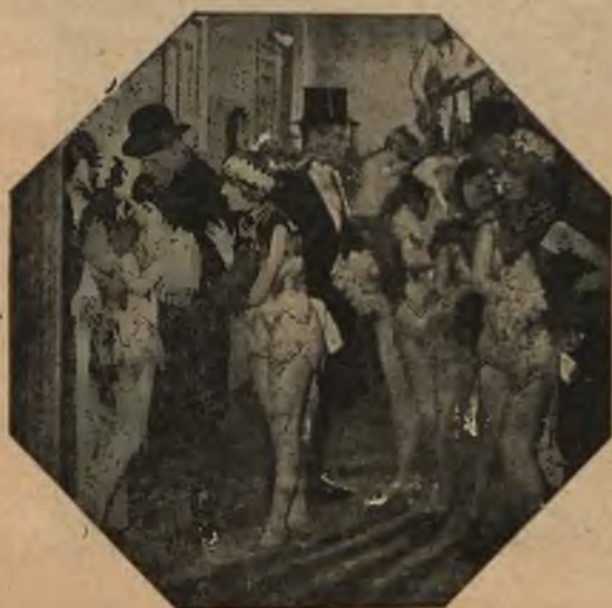
Scena z filmu „Białe Niewolnice”.