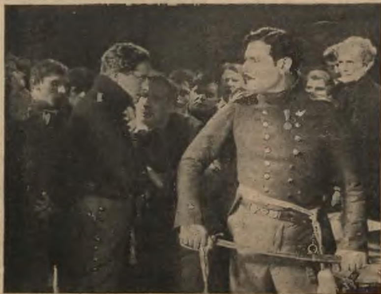
Scena z filmu „Zdrada”.