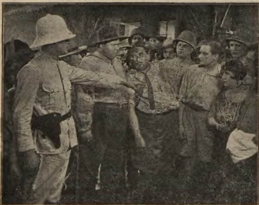
Scena z filmu „Kiedy mężczyzna milczeć musi“.

„Dobre zakończenie“ niezgodne z prawdą realnego życia, teoretycznie