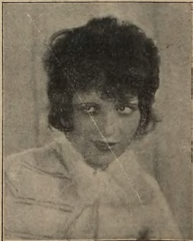
Gwiazda Paramountu Clara Bov.