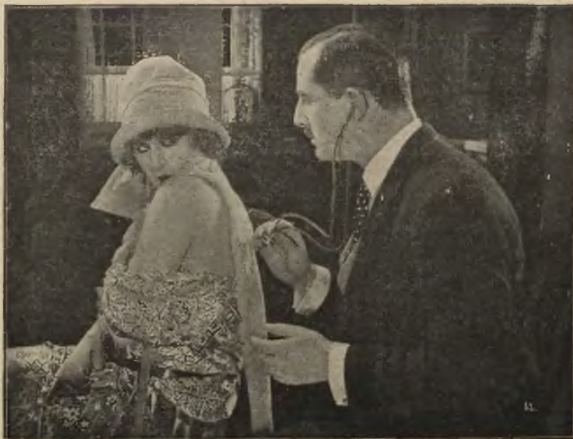
Scena z filmu „Kiedy mężczyzna milczeć musi“

Twórcą specjalnie pomyślanego scenarjusza jest znany autor H. v. Hofmannsthal i to samo daje już poniekąd gwarancję, że eksperyment będzie ciekawy.