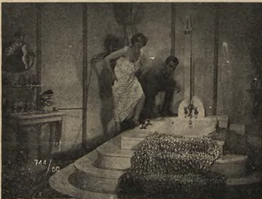
Scena z filmu „Bałamutka mężczyzn“ (wyświetla z powodzeniem kino Fatamorgana).