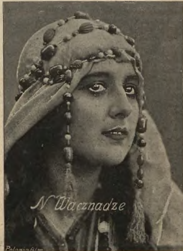
gwiazda wytwórni „Sowkino“.

sfiltrowaniu daje doskonałe srebro. Zastępną, wyjętą z gorącej wody, nawija się na szpulki, łączy się kombinacją acetonu z acetatem i otrzymuje się ce-