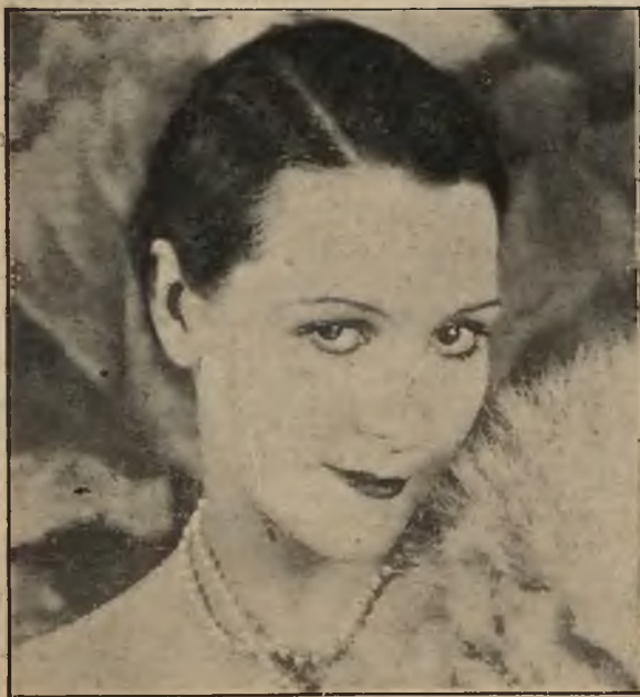
Artystka filmowa A. MARSHALL.