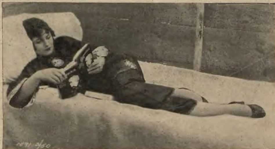
Przepiękna EVELYN BRENT.

następnie lakierek lub skromny grzebień. Wstążka filmowa zawiera kamforę, żelatynę, celuloide i srebro. Przeciętny