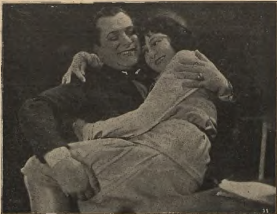
Scena z filmu p. t. „GRZECHY ROZWODKI.

wych miejsc wśród reżyserów. „Karawana“ rozgłosiła jego nazwisko na obu półkulach. Cruze jest reżyserem wszechstronnym, tworzy filmy najrozmaitszego pokroju: sensacyjne, fantastyczne, wizjonerskie („Pod narkozą“) i eksperymentalne. Reżyser wierzy w swój instynkt, który wypływa z „wyczucia“ kina. Najoryginalniejsze pomysły przychodzą mu w czasie inscenizacji filmu, które realizuje zawsze w bardzo szybkim tempie. — Cruze — w przeciwstawieństwie do innych reżyserów, którzy są obojętnymi widzami i obserwatorami, bierze w filmie sam żywy udział i przeżywa niejako akcję — może właśnie dlatego idzie mu praca łatwiej