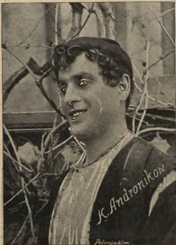
w jednej z popisowych ról.

stwa Harry Loyda służą nam może jako wytwórny lakierów — lub może piękne panie, nie wiedząc o tem, chętnie