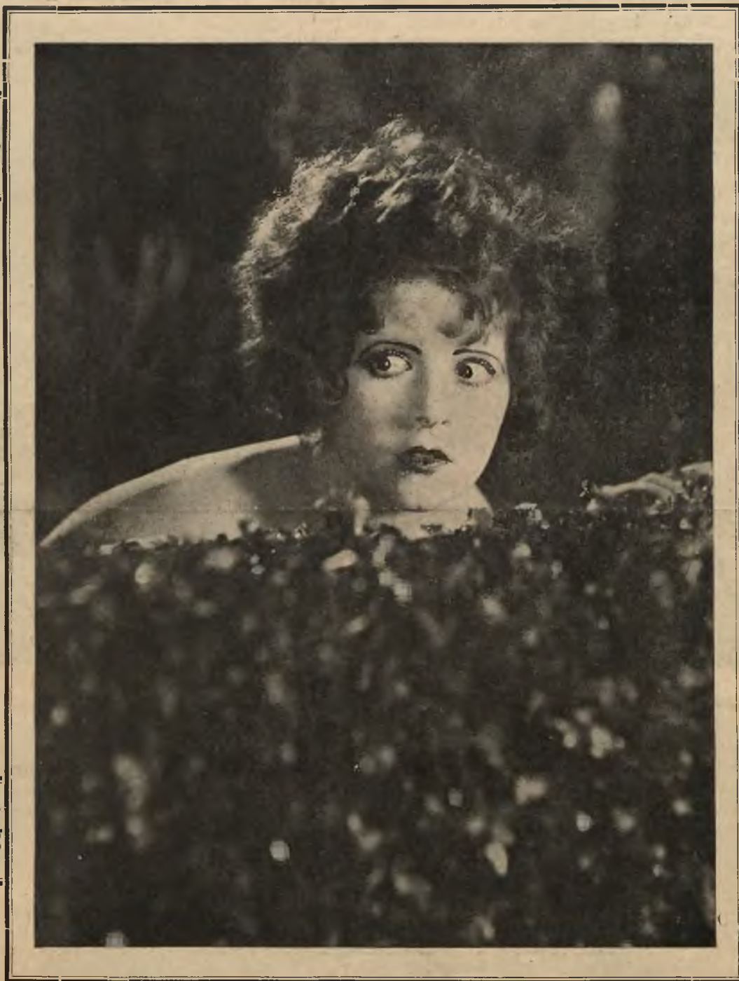
Czołowa gwiazda „Paramountu” CLARA BOW, w filmie p.t. „Ona ma coś”.

(Film ten ukaże się wkrótce na ekranie Kina „LEW“.)