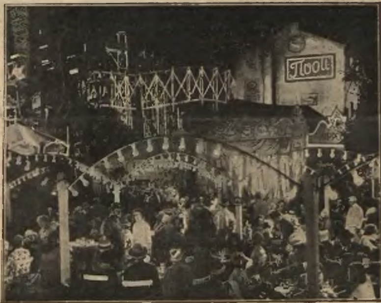
Scena z filmu p. t. „NIEWOLNIK ZMYŚŁÓW“.