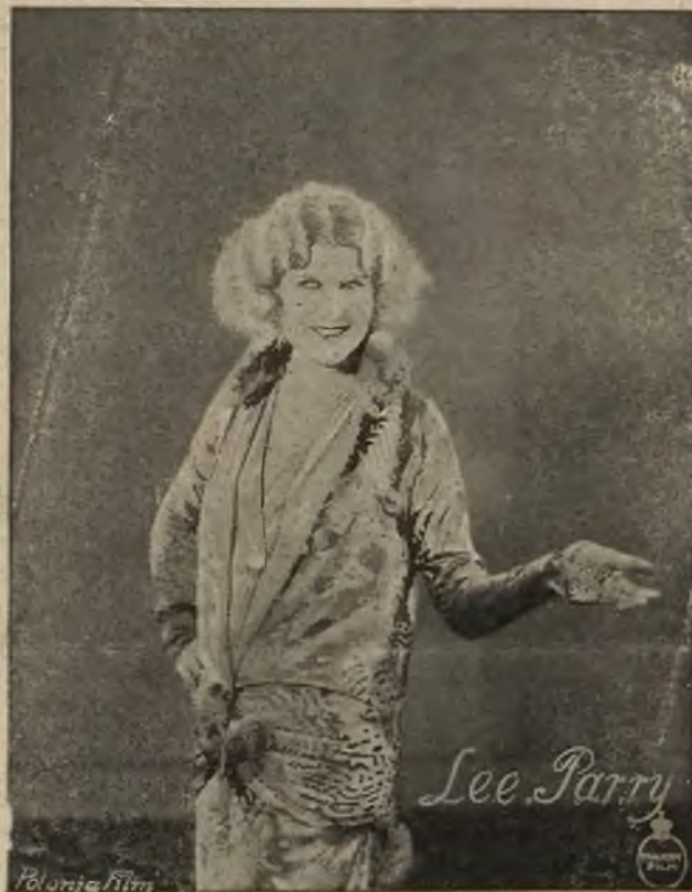
Bohater filmu „Lekka Izabela“ (wyświetla tu kino „Lew“).