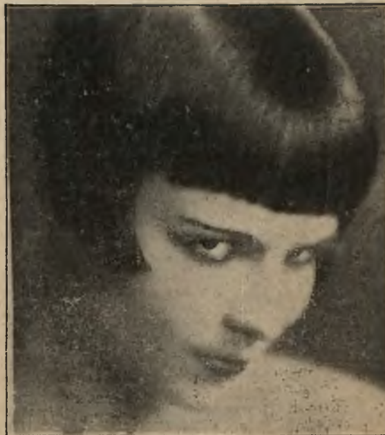
L. BROOKS.

James Cruze doszedł do sławy dzięki usilnej pracy i niesłychanej energii. W początkach patrzano na kino lekceważąco, niedoceniano jego znaczenia kulturalnego, trudno było znaleźć aktora, któryby grę dla kina nie uważał za coś hańbiącego i nie licującego z jego powagą artysty. James Cruze po długim wahaniu przyjął rolę w sensacyjnym filmie, znęcony sówitą nagrodą i chwila ta decyduje o jego dalszej karierze — jakiś czas jest aktorem, potem zostaje reżyserem. Rezultat jego pracy przeszedł najśmielsze oczekiwania i od razu zajmuje jedno z czoło-