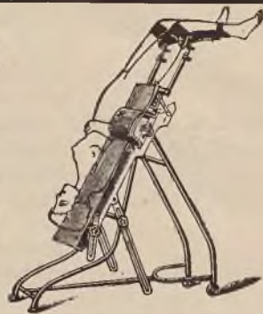
Stół operacyjny według Dra Stase D. R. G. M. używany w krakowskiej klin. c. chirurgicznej.