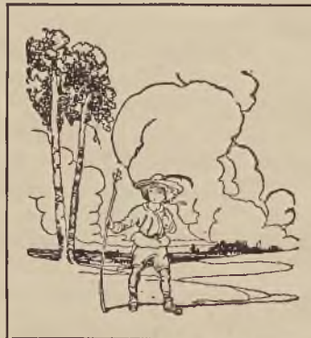
O JANKU WĘDROWNICZKU

O Janku wędrowniczku . Prześliczny poemacik dla małych dzieci. Z rysunkami Ant. Gawińskiego . W ozd. opr. zł. 3.— To książeczka osobliwa . Poezycy tomik I z 32 rys. A. Gawińskiego . W ozd. opr. zł. 3.— O Krasnoludkach i Sierotce Marysi . W opr. zł. 8.— Cztery pory roku . Piosenki ze śpiewnika. Słowa oddzielnie. zł. — 35