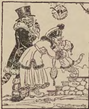
PRZYGODY SZKOLNE PIMPUSIA SADEŁKO

FILUS, MILUS I KIZIA Nasze kotki Wierszem opowiedziała Marja Konopnicka . Z 28 rys. B. Nowakowskiego . W ozd. opr. zł. 3.—.