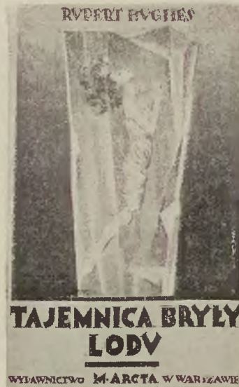
Powojenna powieść amerykańska. Cena zł. 6,40, w opr. zł. 8.