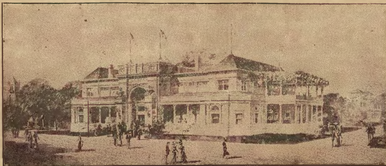
Budynek Stanu Kansas.