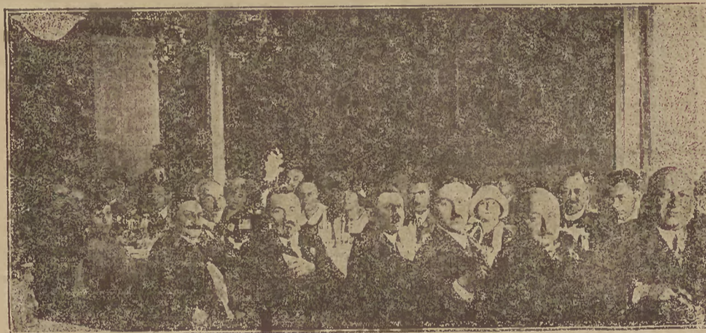
Częstochowa witała w swych murach gości węgierskich. — Na zdjęciu powyższym widzimy gości węgierskich w towarzystwie przedstawicieli władz rządowych i municypalnych w sali restauracji „Polonji”