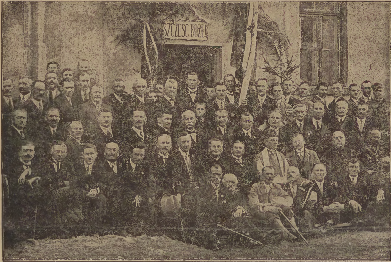
W dni 12 b. m. odbyło się w Częstochowie poświęcenie kamienia węgielnego pod szkołę rzemiosł. Zdjęcie nasze przedstawia organizatorów tej tak pożytecznej placówki.