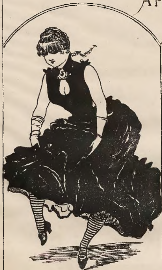
Phyloxera choreograficzna. Specjalność: niszczenie powszechne.