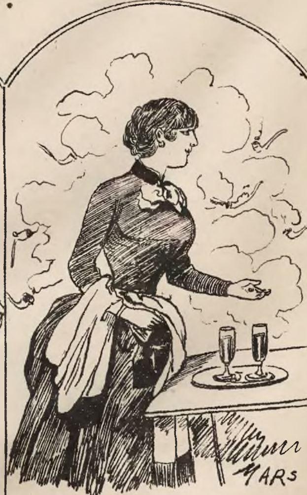
„Garsonka” w piwiarni. Przepada za „piwem” w formie brzęczącej i pod tym względem ma ciągle pragnienie — choć się nigdy nie upija...