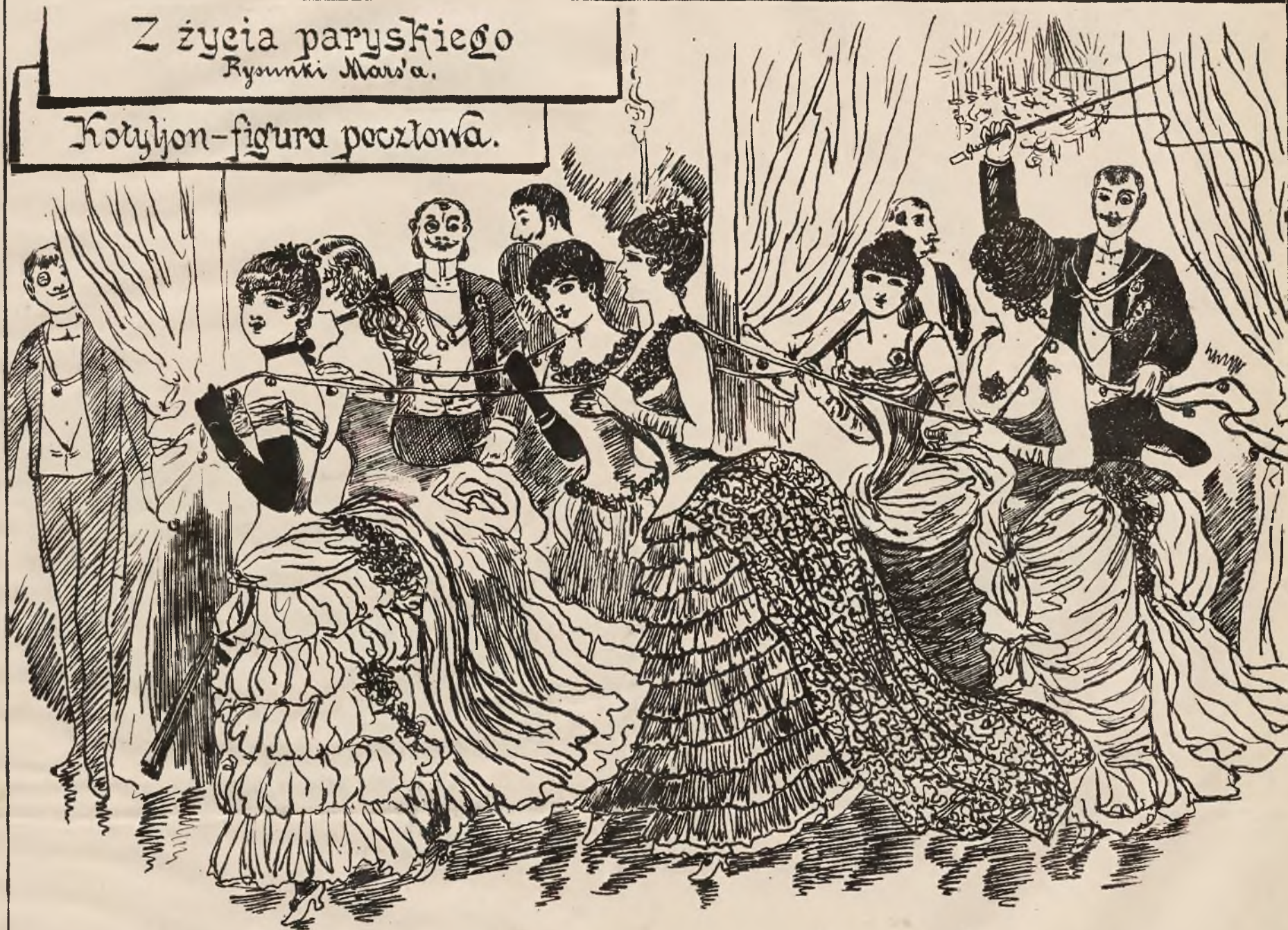
Szczęśliwy poczytjon pęka z bicia, a ci którzy patrzą wzdychają do furmanstwa i... oblizują się...