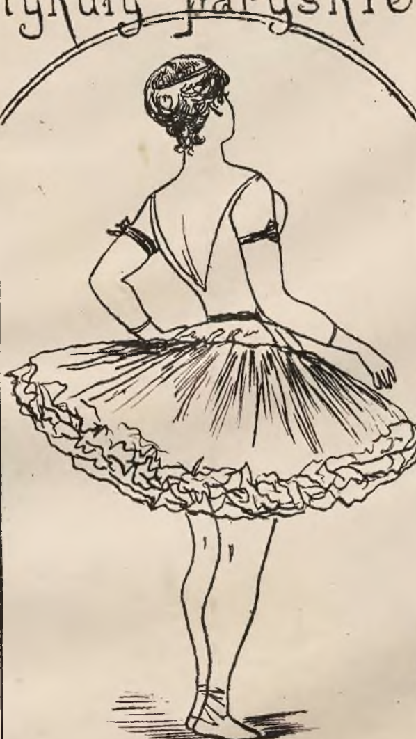
Balerina. Symfonia biała i różowa — gdyby od niej zależało, chciałaby całemu światu pokazywać się... różowo.