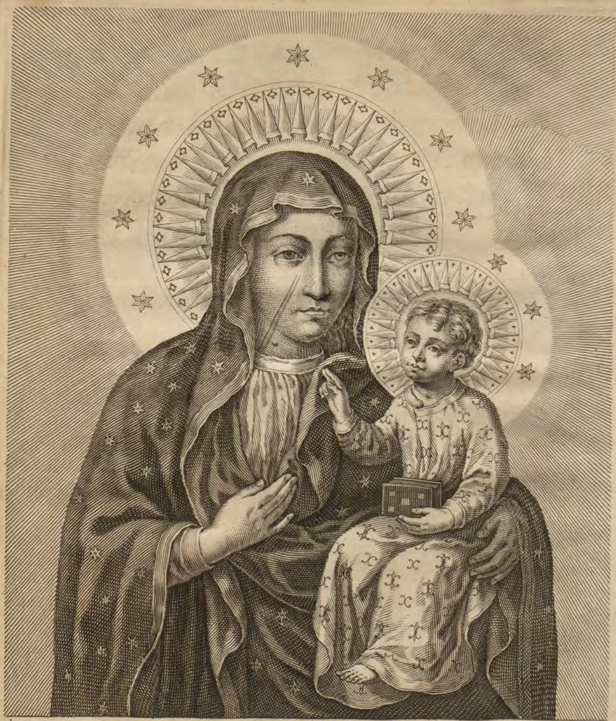
IMAGO BEATÆ MARIAE VIRGINIS CLARIMONTIS CZESTOCHOVIENSIS IN REGNO POLONIÆ DEPICTA Â S T O IVCA