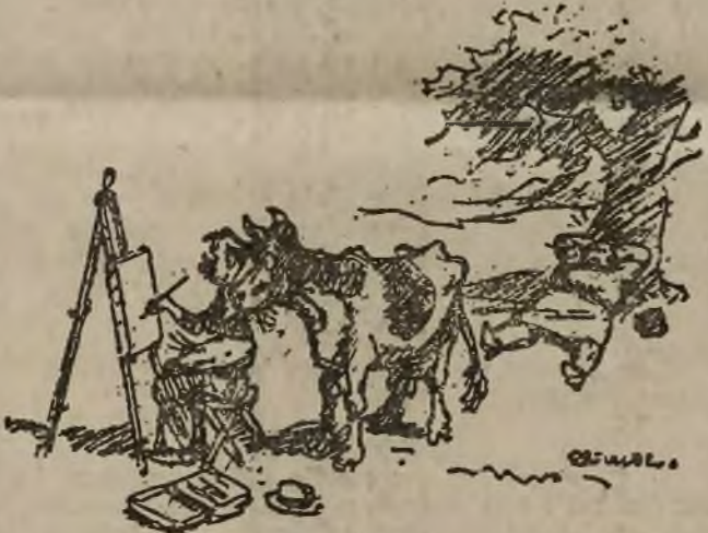
„Nun, Liebling — wie gefällt dir das Bild?“

Ein „jüdischer“ Chemann. Auf der ulica Bytomska überfiel ein Chemann seine Frau und mißhandelte sie derart, daß sie sich nur durch die Flucht in die Feuerwache vor weiteren Mißhandlungen retten konnte. Die Verletzungen waren so schwer, daß die Frau in das Krankenhaus überführt werden mußte.