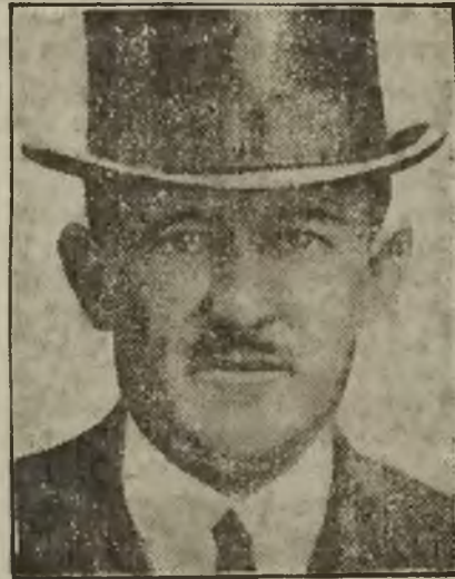
Der Generalsekretär der Haager Schlusskonferenz

mene Teilung in einen politischen und einen wirtschaftlichen Ausschuss soll diesmal vermieden werden. Die Konferenz wird wie auch im August im Binnenhof, jedoch nicht in den Räumen des niederländischen Senates, sondern in der Abgeordnetenkammer tagen. Die technischen Vorkehrungen für die Abhaltung der Sitzungen, von Verhandlungen und für die Presse sind in umsichtiger Weise geregelt worden. Einige Abordnungen sind z. T. bereits eingetroffen.