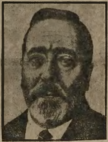
Reichsfinanzminister a. D. Dr. Dernburg der einstige Staatssekretär des Reichskolonialamtes, Mitbegründer und Reichstagsabgeordneter der Demokratischen Partei, wird am 17. Juli 65 Jahre alt.

wärts“ bemerkt dazu u. a. das Kabinett belone noch immer den Wunsch, seine Vorlagen auf dem geordneten parlamentarischen Wege durchzubringen und wenn irgend möglich, auf die Anwendung des Artikels 48 zu verzichten. Aber seine Aussichten seien keineswegs glänzend. Alle Wahrscheinlichkeit spreche zur Zeit dafür, daß der größte Teil der Deutschnationalen bei seinem unbedingten Nein verharren werde. Es hätten Wege gegeben und gäbe sie heute noch, die von allen Seiten als notwendig erkannte Gesundung unseres Finanzwesens auf andere Weise zu erreichen. Das Kabinett habe nicht einmal ernstlich geprüft, ob eine Mehrheitsbildung auf anderer Grundlage als der von ihm gewünschten zu erreichen gewesen wäre und es schide sich nun an, den Staat und sein Gefüge der größten Gefahr auszusetzen, nachdem es mit seinen privaten Wünschen nicht durchgedrungen sei.