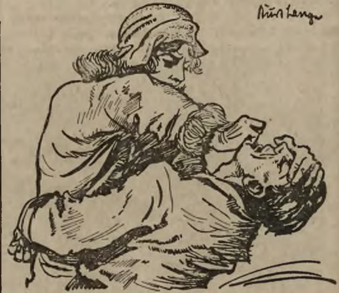
Selbst eine Frau erwehrt sich des stärksten Gegners, wenn sie das Jiu-Jitsu beherrscht.

Es ist ein charakteristisches Zeichen unserer Zeit, daß man gegenwärtig für die Selbstverteidigung als Sport oder, anders ausgedrückt, für den Sport der Selbstverteidigung lebhaftes Interesse zeigt und daß die Sportbegeisterung großer Massen stets beim Kampf Mann gegen Mann ihren Höhepunkt erreicht. Allerdings hat das Jiu-Jitsu bei uns noch sehr viele Gegner. So sind — allerdings nur unter denen, die es nicht kennen — zahlreiche der Ansicht, daß man nicht das Recht habe, es als Sport anzusprechen. Als Begründung wird angeführt, daß es roh sei. Andere wieder meinen, daß es sich nicht zum Training eigne, weil es unbedingt mit den größten Gefahren verknüpft sein müsse. All diese Behauptungen sind ebenso unberechtigt wie unzutreffend. Zur Begründung sei hier einiges allgemein Interessierendes gesagt.