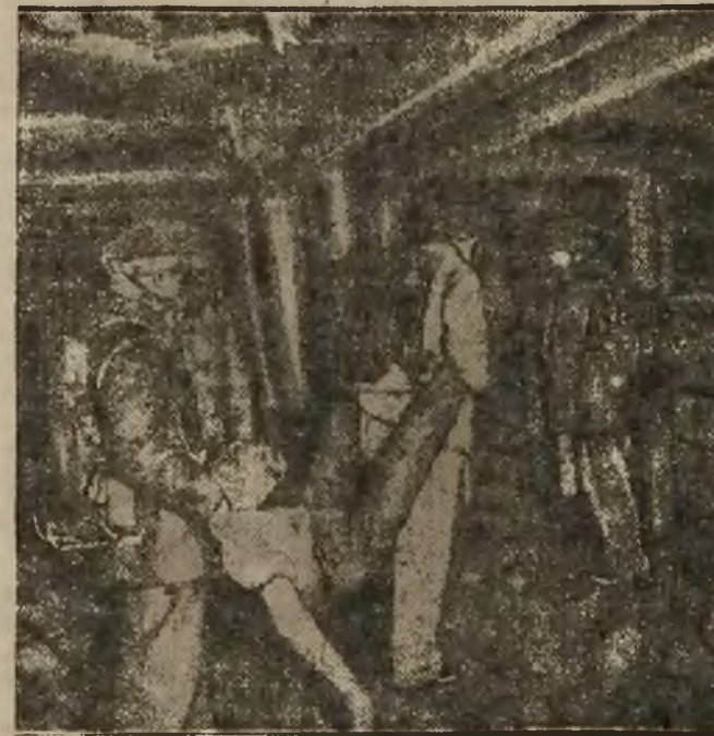
Rettungsarbeiten im vergastem Schacht

Vor dem Lazarett und Krankenhaus spielen sich herzerreißende Szenen ab. Tafeln, auf denen die Namen der Toten und Verletzten verzeichnet sind, werden von den Angehörigen umlagert. Ruhig kommt ein Mütterlein mit der Tochter und sieht zur Tafel hin. Es glaubt nicht, daß der Ernährer unter den Toten sein kann. Aber die jungen Augen finden den Namen des Vaters schneller und dann ein Erschrecken, ein Aufschrei, herzerreißend der Anblick. Und immer wieder erschütternde Szenen. Mütter