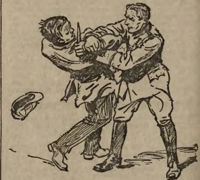
Gegen den Messerhelden schützt man sich durch einen kunstvollen Griff, der seinen Arm fesselt. Je stärker das Sträuben, desto vernichtender sind die Folgen für das Schultergelenk.

Nach dem russisch-japanischen Kriege wandte sich die allgemeine Aufmerksamkeit Japan zu. Die Japaner verstanden diese Gelegenheit auszunutzen. So sandten sie ihre besten Jiu-Jitsu-Kämpfer in alle Länder, vornehmlich nach Amerika, um dort ihre Kunst zu zeigen