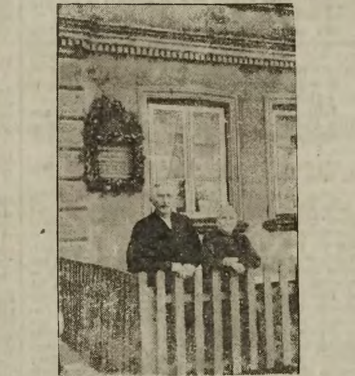
Gorch Fock — Ehrung

Panzerwagen mit Maschinengewehren aufbaut, die auf der Straße aufgestellt wurden. Die Demonstranten warfen mit Steinen und aus den Fabriken mitgebrachten Bleikugeln zahlreiche Fenster ein und verwundeten viele Passanten. Allein in einem in der Nähe befindlichen Sanatorium wurden 200 Leute mit Notverbänden versehen. Zur Fortschaffung der Verwundeten mußten Privatautomobile in Anspruch genommen werden, auf denen die rote Kreuz-Flagge gesetzt wurde.