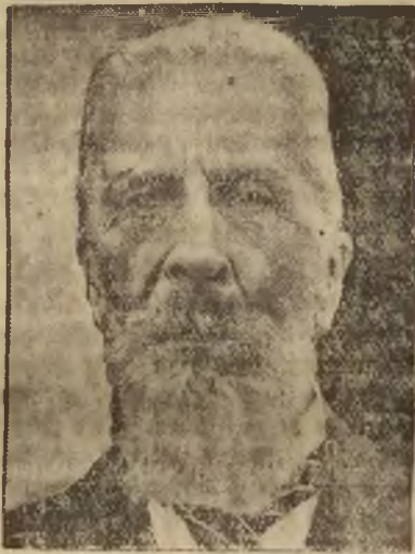
Graf Albert Apponyi

Genf. Die mehrtägige große Aussprache über den französischen Abrüstungs- und Sicherheitsplan hat zusammenfassend ergeben, daß der französische Plan von den Großmächten als eine Grundlage für die Lösung der Abrüstungsfrage abgelehnt wird. Die amerikanische Regierung hat in der fühlenden und zurückhaltenden Erklärung des Botenmeisters Gibson eine Stellungnahme abgelehnt und sich damit im wesentlichen als desinteressiert erklärt. Die Mostauer Regierung bezeichnet den französischen Plan als eine neue Methode der Abrüstung und lehnt eine Teilnahme am französischen Sicherheitsplan ab. Die englische Regierung hat ihrerseits in eindeutiger Form die Ablehnung irgendwelcher neuer Sicherheitsverpflichtungen schloß als unannehmbar von sich gewiesen. Die japanische Regierung hat bezeichnenderweise zu dem französischen Plan überhaupt keine Erklärung abgegeben. Deutschland, Italien und Holland haben weitgehendste scharfe scharfe Kritik an dem französischen Plan geübt und den Grundgedanken des französischen Planes, erst Sicherheit, dann Ab-