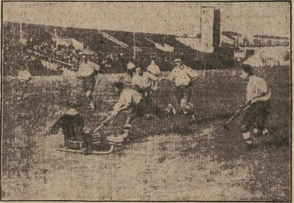
Von den olympischen Hockey-Spielen in Amsterdam

und betreffen die Grund- und Wohnbausteuer auf dem Lande, wogegen sich die Bauern wenden, da nach ihren Angaben schon heute die Steuerlasten unerträglich sind. Regierungsseits wird behauptet, daß diese Steuer das Budget in seiner heutigen Form gefährde, nachdem die Regierungsprojekte abgelehnt wurden. Gegen die Projekte stimmten neben den Bauernparteien, der D. R. S. auch ein Teil der Rechtsopposition, sowie die nationalen Minderheiten, bei Stimmenthaltung des deutschen Klubs. In den späten Abendstunden trat die Regierung zu einer besonderen Sitzung zusammen, um über diese unerhoffte Ueberraschung zu beraten.