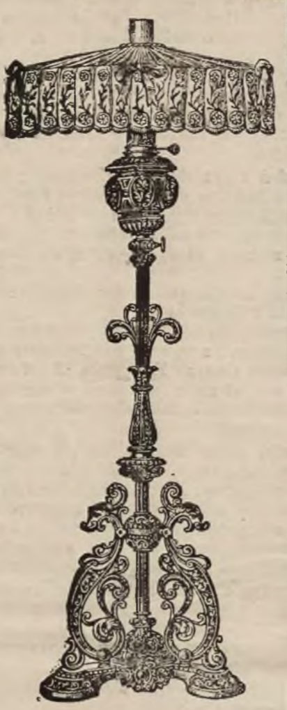
Lampa postumentowa z koronkową umbrą.

Lampy „Astral“ 20 i 30" siła świetlna 58 i 104 świec. Lampy Astral mają tak praktyczną formę, że mogą być w najrozmaitsze sztafelowane lampowe wstawione.