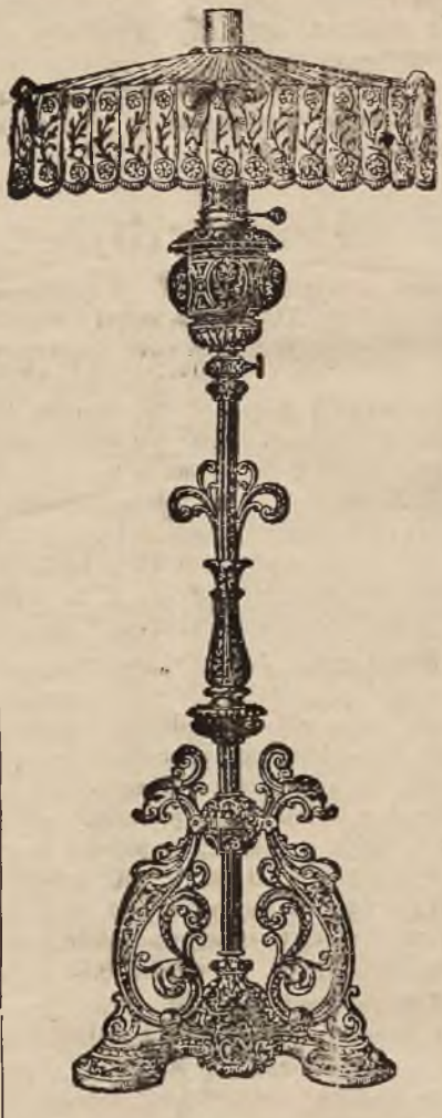
Lampa postumentowa z koronkową umbrą.

Lampy Astral mają tak praktyczną formę, że mogą być w najrozmaitsze sztelaze lampowe wstawione.