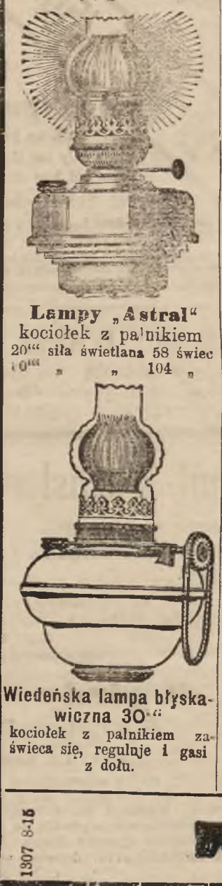
Lampy „Astral” kociołek z palnikiem 20" siła świetlna 58 świec 104"

R. Ditmara główny skład lamp Lwów, plac Marjacki 1. 9